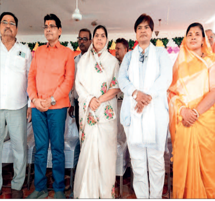
किसानों को बोनस, कृषि यंत्रों में सब्सिडी और ड्रोन से खाद का छिड़काव किया जा